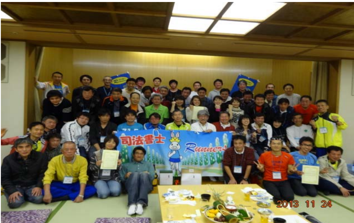
写真：第5回ひだか茂平マラソン懇親会（前回大会）