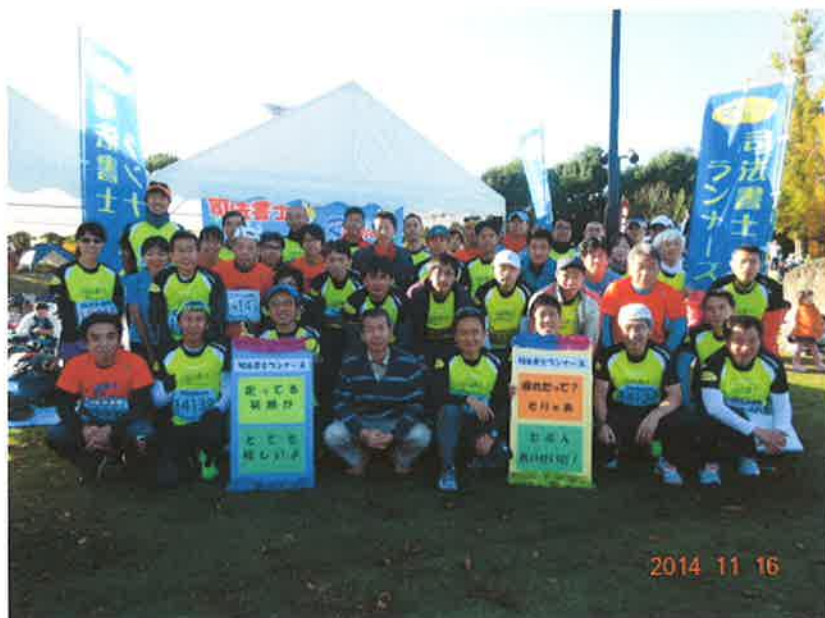
写真：第28回宇都宮マラソン大会（第6回大会）