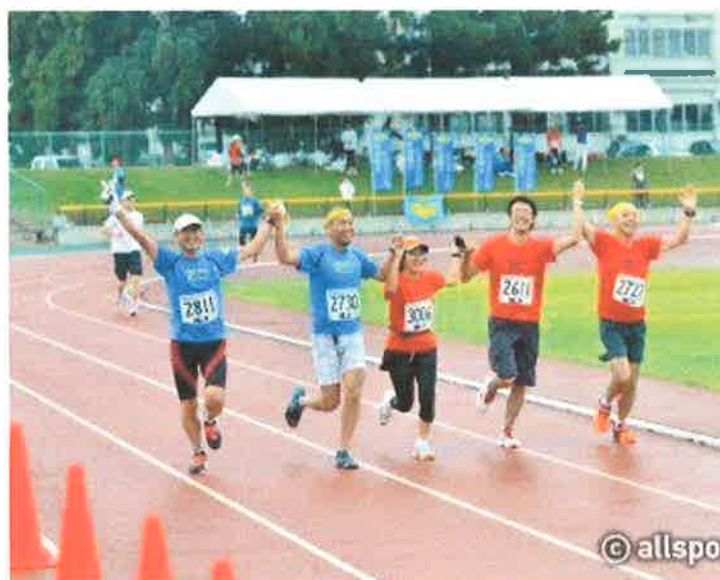
米沢おしょうしなハーフマラソン大会にて（第4回）