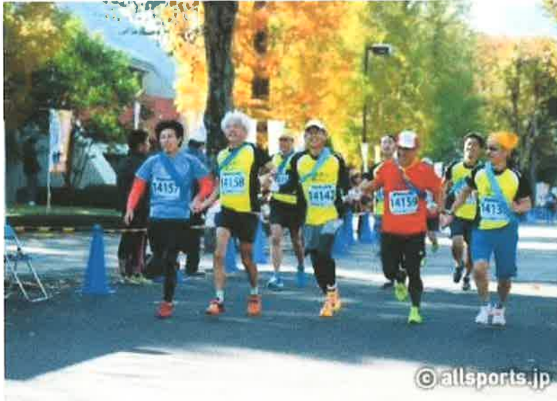
宇都宮マラソン大会にて（第6回）