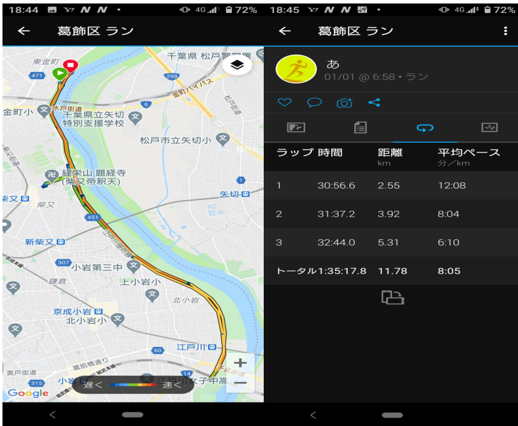
江戸川の初日の出、帝釈天